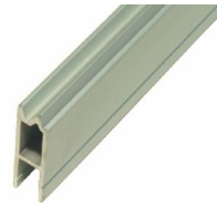
NC2HE Omkeerbaar sluitprofiel

Er zijn vier verschillende kunststof hoeken die gebruikt kunnen worden in combinatie met de profielen.