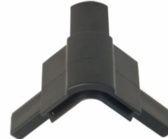
NC2HCLK bovenkant hoek t.b.v. omkeerbaar sluitprofiel NC2HE