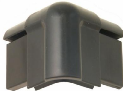
NC2LC54K hoek voor dekselprofiel NC2LE54