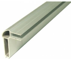
NC2LE54 Dekselprofiel 54mm