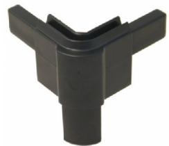
NC2HCBK onderkant hoek t.b.v. omkeerbaar sluitprofiel NC2HE