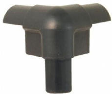
NC2C3K hoek voor hoekprofiel NC2DAE

De hoeken zijn ontworpen om precies in de profielen te passen.